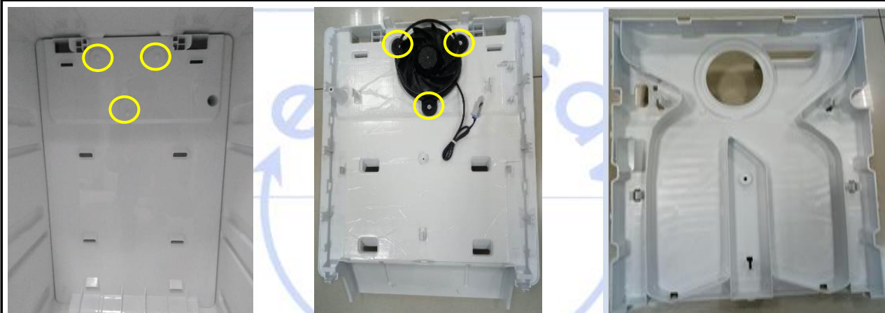
FMF121310000388 - CONDUIT V1