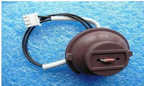
Sonde inducteur = 120kΩ~ à 20°C (+/- 5%)